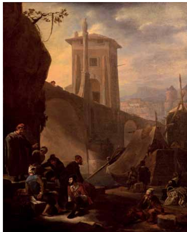
Johannes Lingelbach (1622-1674), Paysage italien , huile sur toile, 64,5 x 53 cm. Dans cette peinture du XVII e siècle, le moindre détail invite au voyage : elle dépeint le départ d'un bateau d'un port italien vu par un Néerlandais qui y était lui-même de passage.