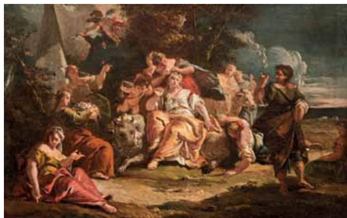
Francesco Fontebasso (1707-1769), L'enlèvement d'Europe , 1740-50, Venise, huile sur toile, 39 x 63 cm.

Europe, la fille du roi phénicien Agenor, fut emmenée de force par Jupiter. Sous l'apparence d'un taureau, il la séduisit au moyen de jolies fleurs et l'enleva. Ce thème est emprunté aux Métamorphoses d'Ovide, grande source d'inspiration à partir du XVI e siècle. Les histoires des dieux antiques et de leurs colères constituaient une source abondante pour les peintres, avec une licence érotique certaine, relativement tolérée alors.