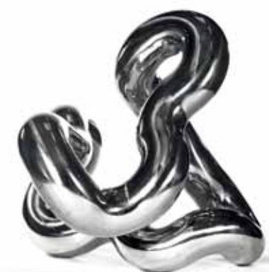
Ben Swildens (1938), Iron Wave , 2013, inox poli, 100 x 120 x 100 cm.

Ce tourbillon infini, sans début ni fin, semble figé dans le temps. Mais sa surface réfléchissante, dans laquelle il est possible de se mirer, permet tout de même de se fixer une dimension temporelle. Cette sculpture permet une introspection, une quête de soi-même, un voyage dans le 'moi' le plus profond.